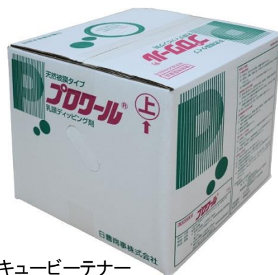
18L キュービーテナー (コック付)

※キトサンは、カニ殻を酸・アルカリ処理して得られる多糖類で、溶解したものは乾くと抗菌性を有する被膜を形成します。